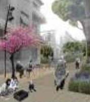
Πολυζώιδης Θανάσης, Πέτσιου Κατερίνα