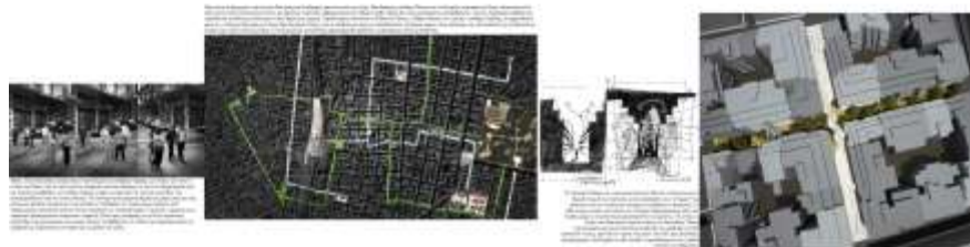
Μπαμπανέλος Αθανάσιος, Βογιατζόγλου Ευθαλία